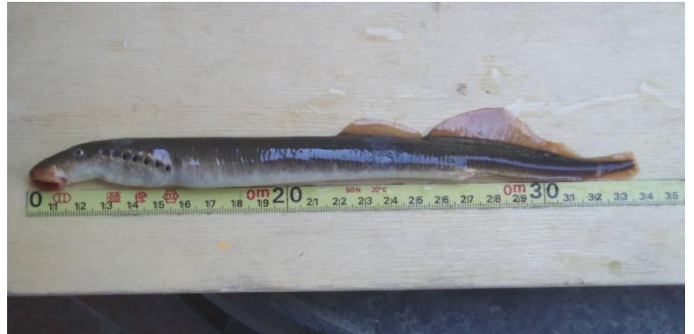
Fig. 5 – L’esemplare di lampreda di fiume catturato sul Vara (SP); ai fini della corretta misurazione della lunghezza totale si noti che la riga centimetrata parte dal valore di 10 centimetri.