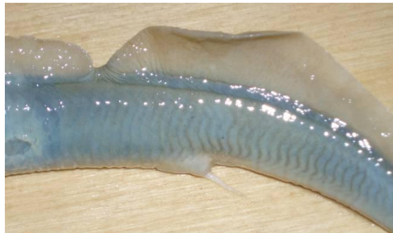
Fig. 2 – Papilla urogenitale maschile dell'esemplare di lampreda di fiume catturato lungo il Fiume Vara.