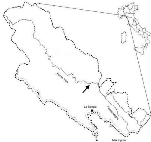
Fig. 1 – Inquadramento territoriale del punto di osservazione della lampreda di fiume, evidenziato dalla freccia, nell'ambito del bacino spezzino del Magra-Vara.