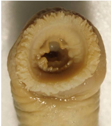
Fig. 4 – Immagine di dettaglio dell’apparato boccale della lampreda scattata successivamente alla preparazione in alcool dell’esemplare.

confermare lo status di specie “in pericolo critico” recentemente assegnato al taxon nell’ambito delle categorie regionali IUCN per la Liguria (Ciuffardi e Arillo, 2007).